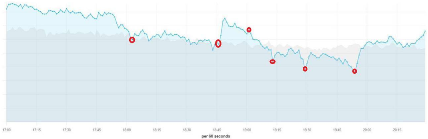
Total active users (plot) and alert status (verticals)