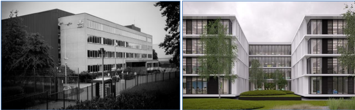
Kantoorruimtes voor en na.

De werken starten deze maand en zullen duren tot eind 2015.